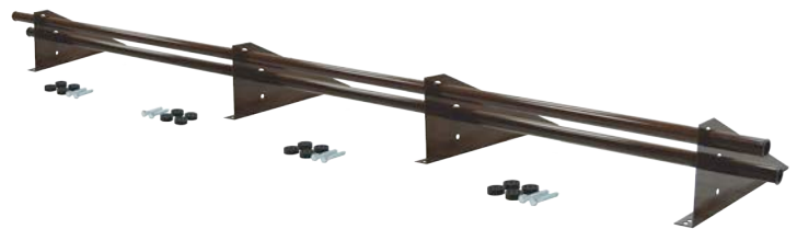
Снегозадержатель Optima Плюс 3 м