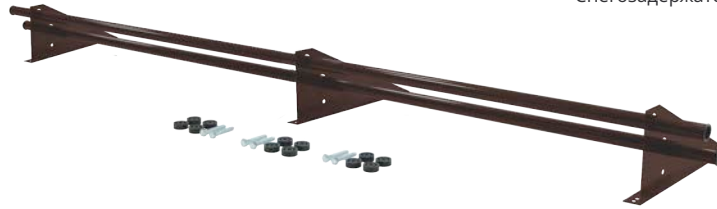
Снегозадержатель Optima 3 м