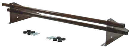
Снегозадержатель Optima 1 м